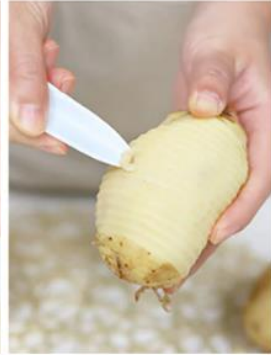
Odstraňte zbytkové pupeny.