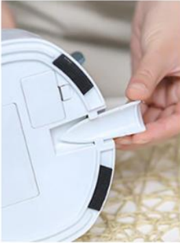
Spodní čisticí čepel