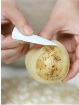
Seškrábněte zbytek na koncích.