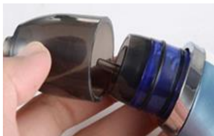
Instale la protección y gírela en el sentido de las agujas del reloj