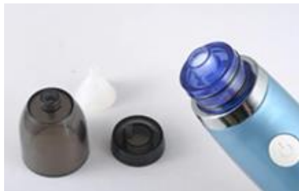
Piezas que se deben instalar. almacenamiento