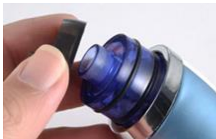
Instale la tapa del espacio de almacenamiento