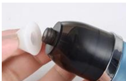
y, luego, instale el pico/boquilla

Si desea desmontar el aparato, siga los pasos en orden inverso.