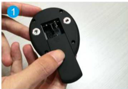
1. Nyissa ki az elemtartót