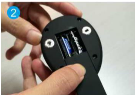
2. Helyezze be az elemeket (2xAAA)