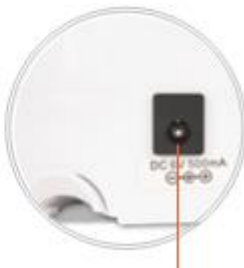
Vstup pre napájanie

Škrabka sa môže používať aj ako káblové zariadenie (bez batérií) s napájacím adaptérom (nie je súčasťou dodávky).